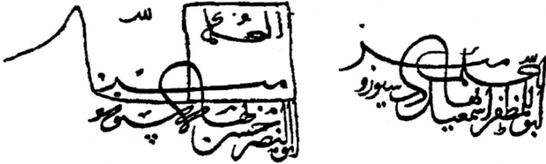
Təsvir 13. Uzun Həsən (sol) və Şah İsmayılın (sağ) tamğaları.

böyük qardaş hesab edəcəyi, şərtini qəbul edərək vassalı olacağını söyləyir. [xxx] Əlvənd dinin qohumluqdan üstün olması prinsipini rədd etdikdə Ağqoyunlular Qızılbaşlar tərəfindən ilk məğlubiyyətə uğradılırlar.